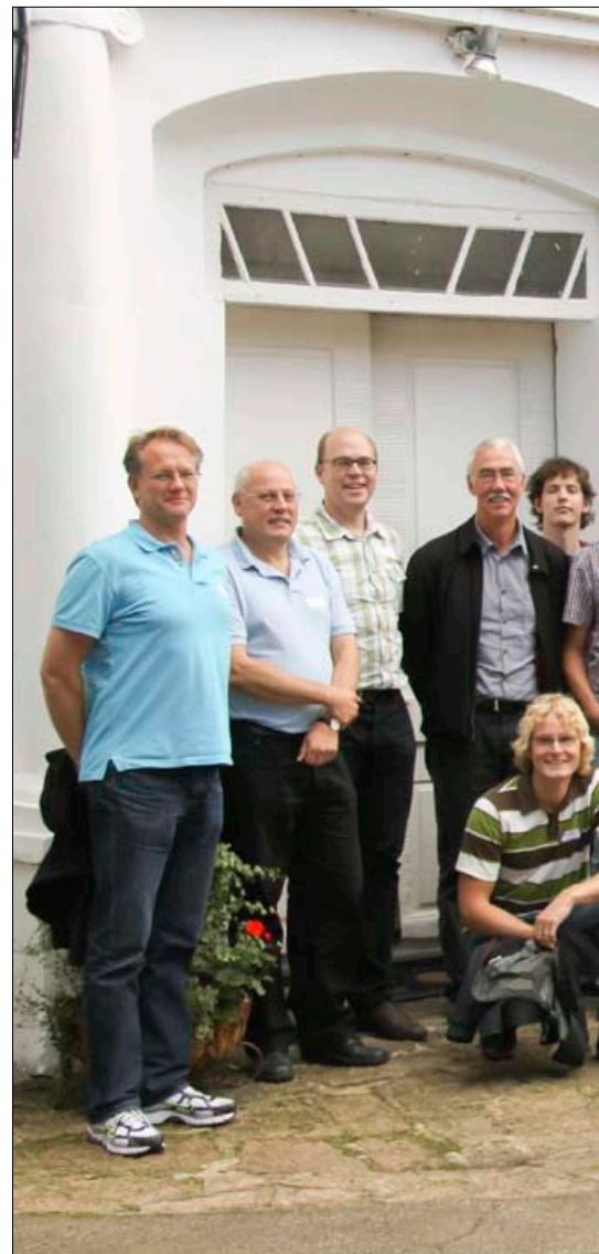
Vi erbjuder Sveriges mest erfarna projektledare, systemutvecklare och automationsingenjörer.

Läs mer på www.cactusuniview.se . Där finns också alla våra kontaktuppgifter och en pdf med vanliga ”frågor och svar” kring samgåendet.